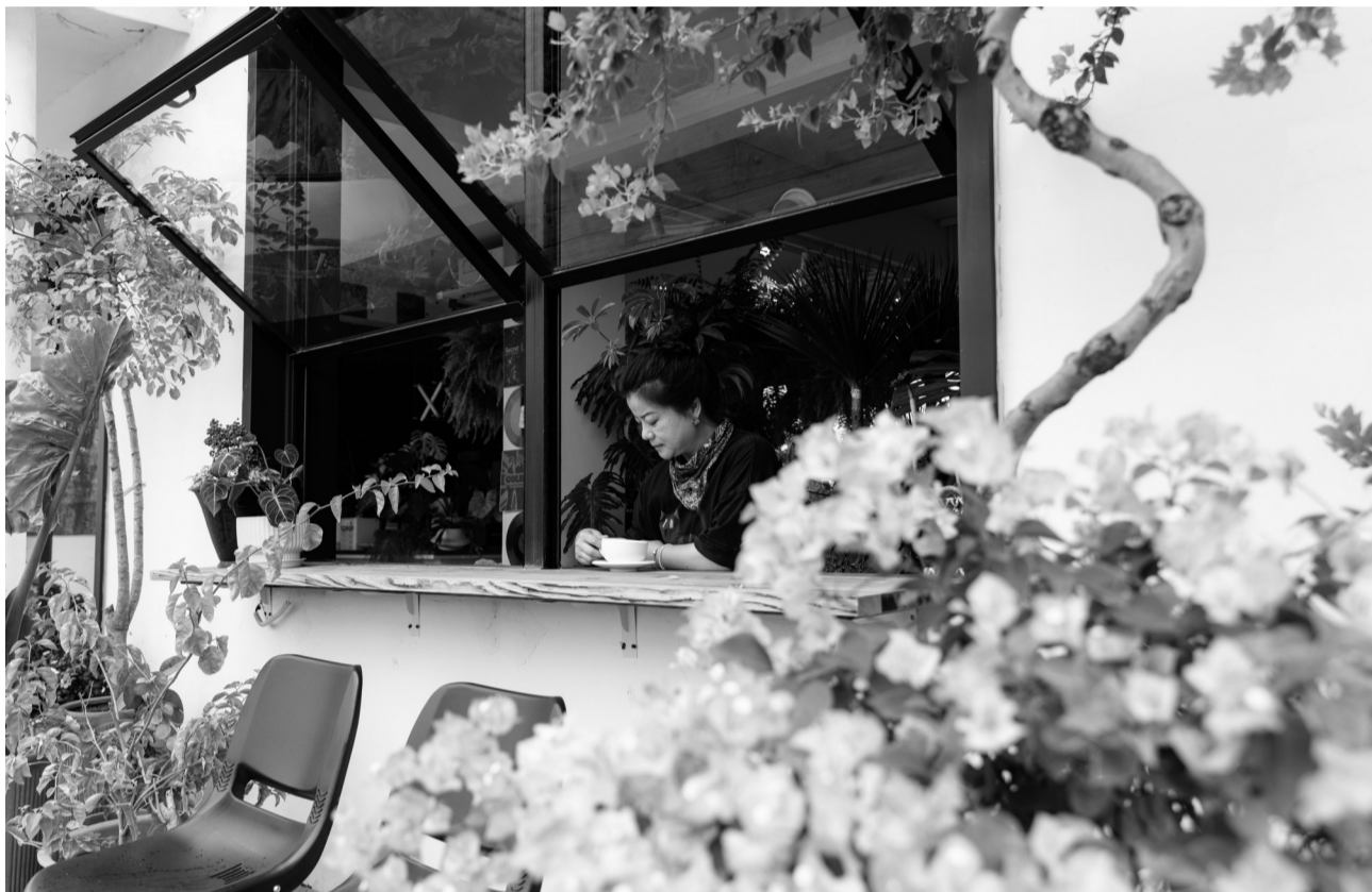
昨天,钟埭街道钟埭村北庄浜的一家乡村咖啡馆内,绿植环绕、繁花点缀,清幽雅致的环境,让该店成为乡村旅游新晋打卡点。