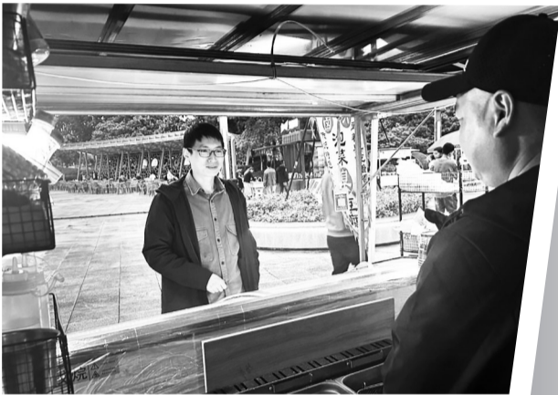
了解摊位经营情况