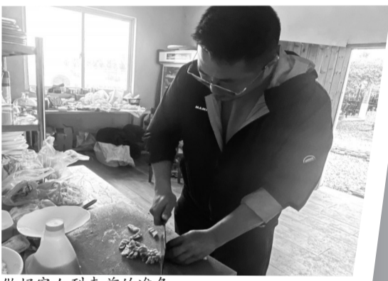
做好客人到来前的准备