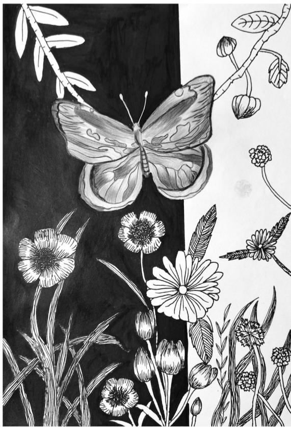
彩蝶 ■毓秀小学419班 方越彤 指导老师 张喜妹