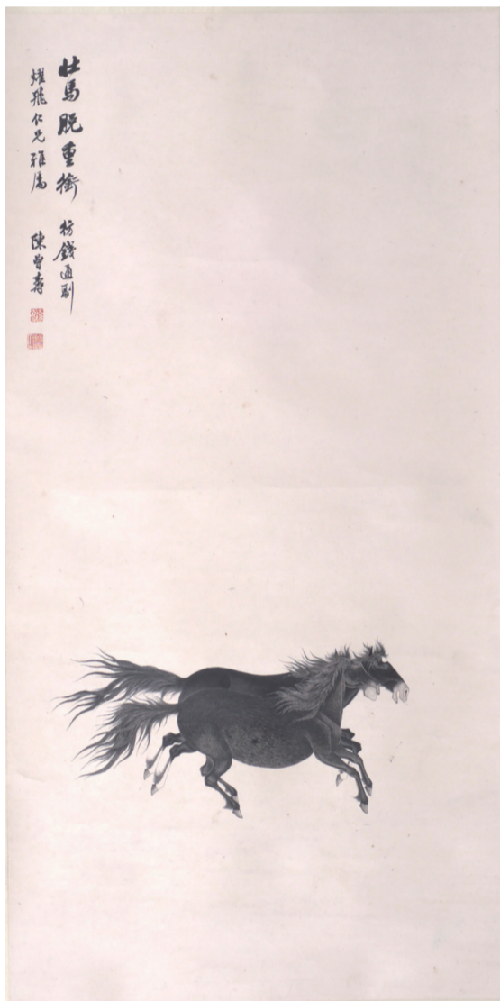
民国 壮马脱重銜图 陈曾寿

千年两马，马踏长风。在历史精神的原野上，马不仅是沙场忠勇的化身，更是文人凌云气象的寄托。它承载着人们对自由、奋进与祥瑞的深切向往，穿梭于历史长河，定格于丹青画卷。本期，邀您共赏平湖市博物馆馆藏的历代画马佳作，让我们一同在笔墨流转间，感受那跃然纸上的骏骨雄风。