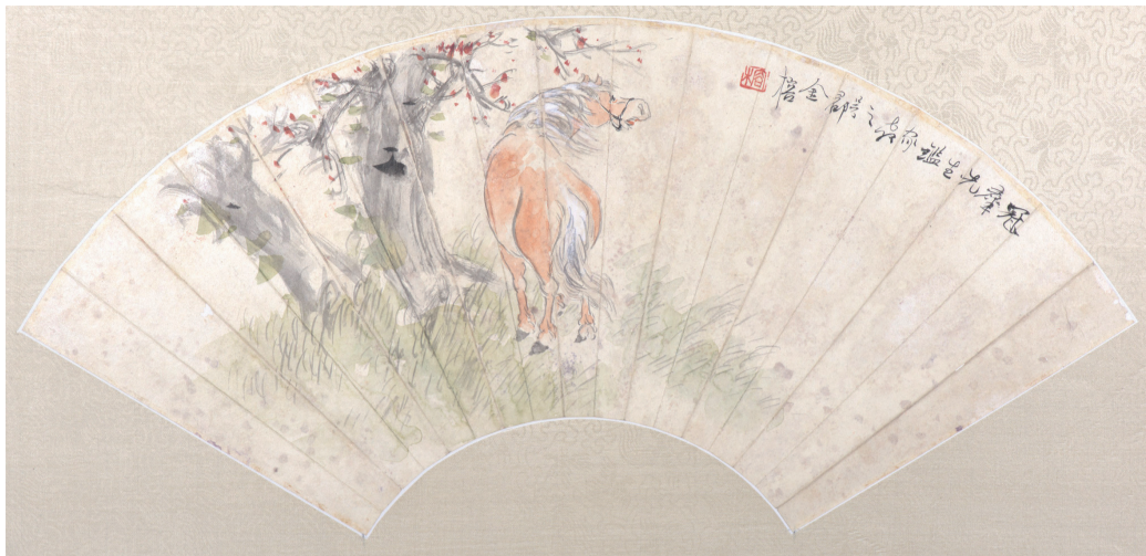
民国 马图折扇页 金榕