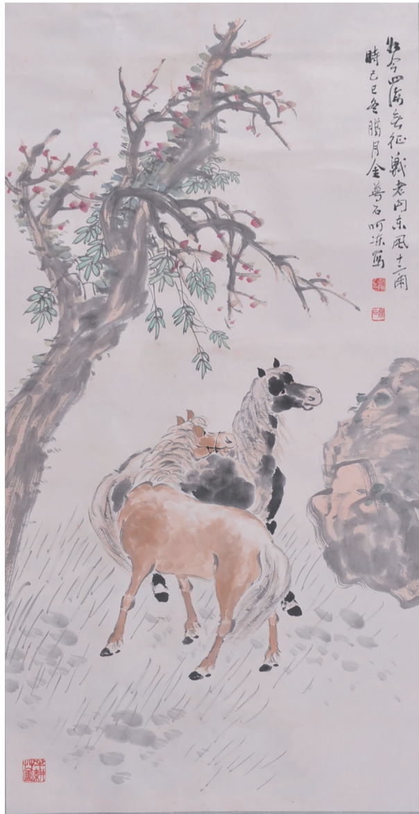
民国十八年 双马图 金俞