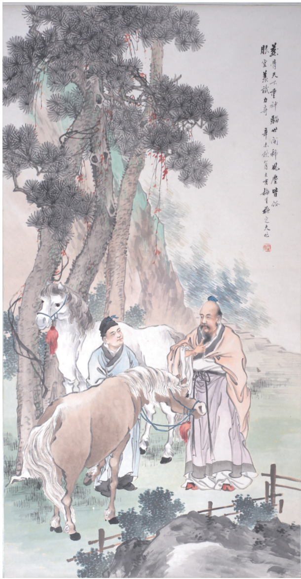
民国二十年 人物图 施桢