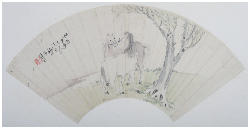
近代 马图扇页 赵鹤双