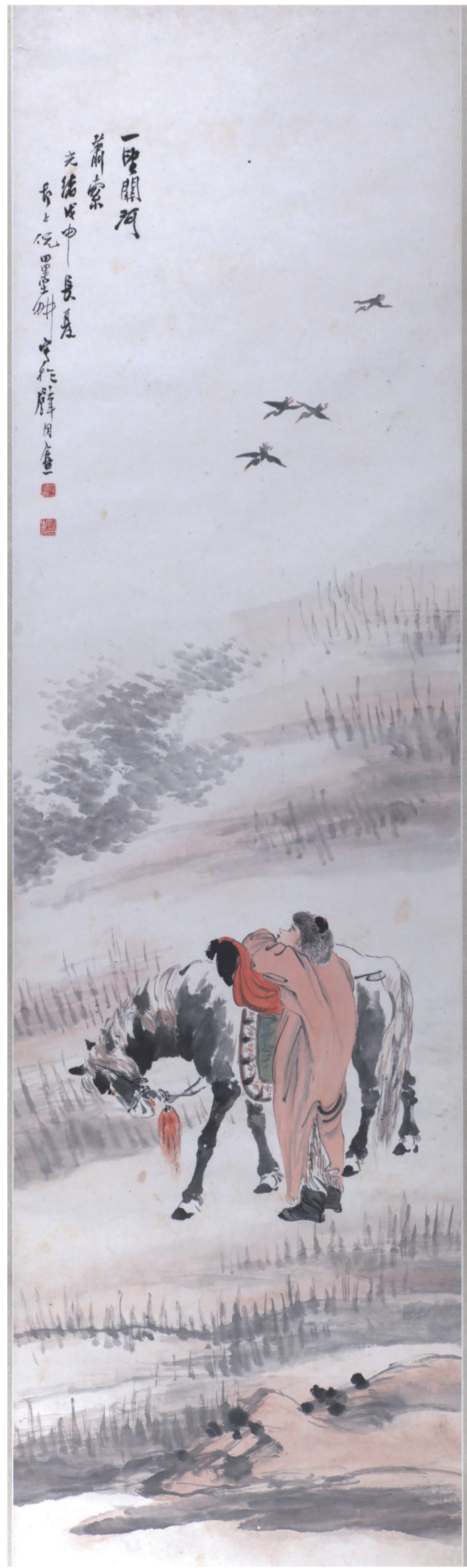
清光绪三十四年 关河萧索图 倪田