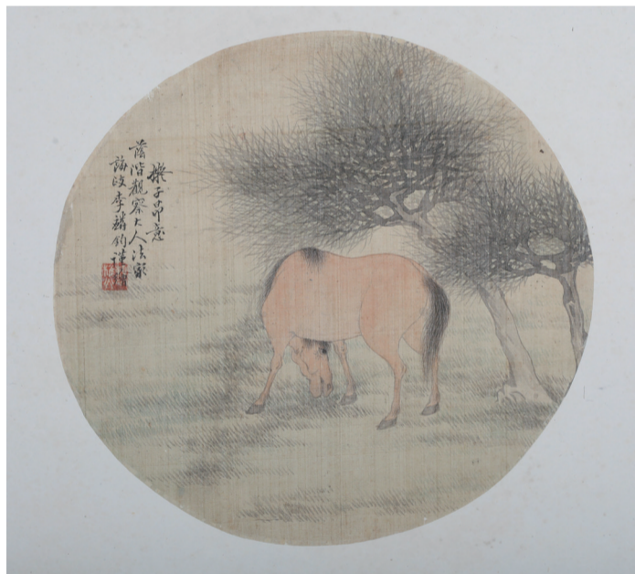
清 松马图团扇页 李麟钧