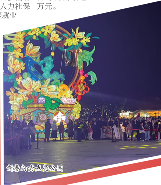
新春灯秀点亮公园