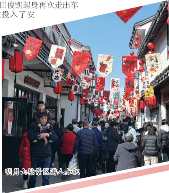
明月山塘景区游人如织