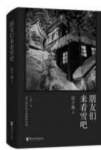
《朋友们来看雪吧》 迟子建 著 浙江文艺出版社

内容简介：《朋友们来看雪吧》是当代文坛大家迟子建亲自选编的短篇小说集，聚焦北国雪境和凡人微光，收录《鹅毛大雪》、《白雪的墓园》、《清水洗尘》（获 2001 年鲁迅文学奖）、《朋友们来看雪吧》、《腊月宰猪》、《雪窗雨》、《采浆果的人》、《塔里亚风雪夜》、《最短的白日》、《炖马靴》10 部经典名篇，作品创作跨度约 30 年，展现了作者在不同阶段对生命本质的思索。这些跨越时空的雪国故事，指向人类共通的情感本质——对生命的敬畏、对苦难的超越、对美好的追寻。这部选集是理解迟子建文学世界的最佳入口，也是学习汉语写作的优质文本。