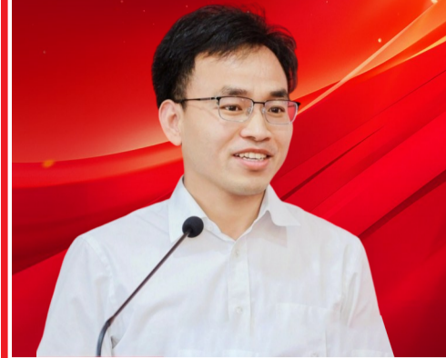
程伟保 | 市经信局 党委书记、局长

2025年，我们与全市企业紧密相连、携手前行，在构筑“3+3+3”现代产业体系路上步履坚实，产业能级持续提升，发展质效不断增强。2026年，我们将锚定更高目标，实干再出发，以创新为根本动力，以企业为发展根基，全力推动工业经济向更高质量、更高水平迈进。