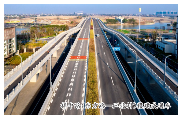
祥中路(东方路—三北村)段建成通车

铺路架桥,既为当下,更谋长远。集团始终着眼未来,为长效服务民生和发展筑牢基础。去年,针对三港大桥存在已久的拥堵“痛点”,全力推进祥中路(东方路—三北村)段的建设并实现通车,有效分流交通,民生反响热烈。同时,提前谋划并启动丰收路维修改造、梦飞路(平廊公路—经三路)道路桥梁工程等一批2026年计划项目的前期工作,同步推进祥中路(子孙桥东引桥-金海洋大道)和雅川路(东方路-东田路)拓宽改造工程前期准备,推动项目早开工、早建设、早见效。在华师大附属平湖学校配套路网建设上,更是将其与秋季开学计划紧密挂钩,确保基础设施与民生需求精准衔接。