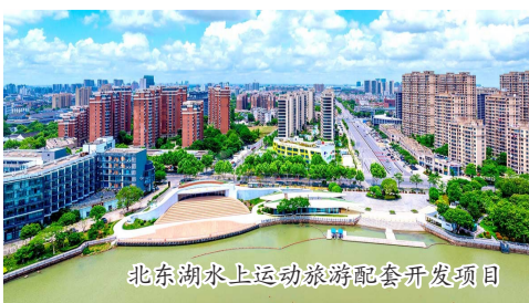
北东湖水上运动旅游配套开发项目

城市形象之美,离不开安全稳定的基底。去年,建投集团加快实施平湖(东湖片区)人居环境提升项目,快速推进上海塘闸站工程,为提升区域防洪排涝能力、守护一方安澜奠定基石。建设过程中,集团聚力构建全维度管控体系,以基础设施的坚固可靠,托举起群众“稳稳的幸福”。目前,水闸部分主体结构完成建设,正在进行闸门安装及启闭机房施工,今年还将开展泵站部分施工,整个项目计划于明年年底完成建设。待整个东湖片区项目完成建设后,将在东湖新区12.39平方公里区域构建防洪包围圈,奏响城市与水共生的和谐韵律。