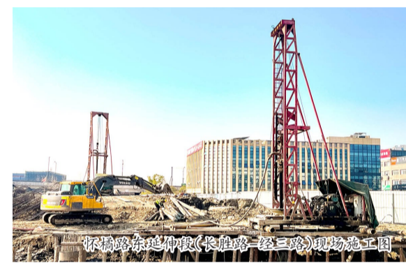
怀橘路东延伸段(长胜路-经三路)现场施工图

经二路(毓秀路-怀橘路)作为学校主要出入通道,未来将直联毓秀路、怀橘路等主干道,有效缓解上下学与周边交通压力。怀橘路东延伸段(长胜路-经三路)作为东湖片区人居环境项目的关键部分,创新采用“以路代堤”设计,通过提升路面标高,实现防洪与交通双重功能。待2个项目建成后,将进一步畅通区域交通微循环,为周边居民营造更加安全、通达、舒适的出行环境。