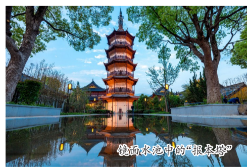
镜湖水中的“报春塔”

团以“绣花功夫”推动历史保护与传承的生动缩影。改造中,集团不仅优化排水系统以守护报本塔,还通过迁回原塔刹、打造镜面水池、重现“塔影垂虹”古韵等一系列匠心举措,让历史脉络始终鲜活在平湖人的生活中。此外,李叔同纪念馆、吴一峰艺术馆等人文展馆也完成改造提升,为市民提供了更具温度的精神休憩处。依托南河头历史文化街区文脉积淀,去年还启动了南河头片区文旅融合提升项目建设,着力打造“河岸即公园、街巷即展廊”的沉浸式游憩网络,以历史文脉滋养城市创新发展。