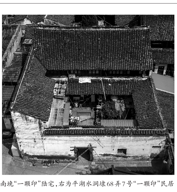
左为新仓镇城隍桥南堍“一颗印”陆宅，右为平湖水洞埭68弄7号“一颗印”民居