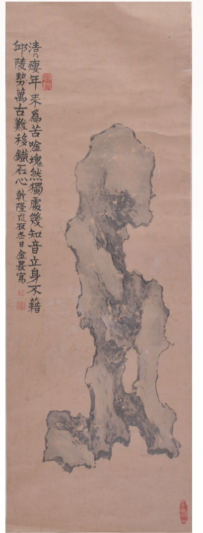
清 仿金农 寿石图