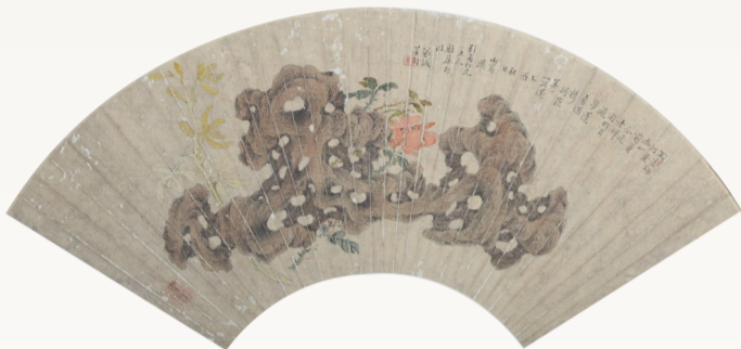
近代 子恩 花石图扇页