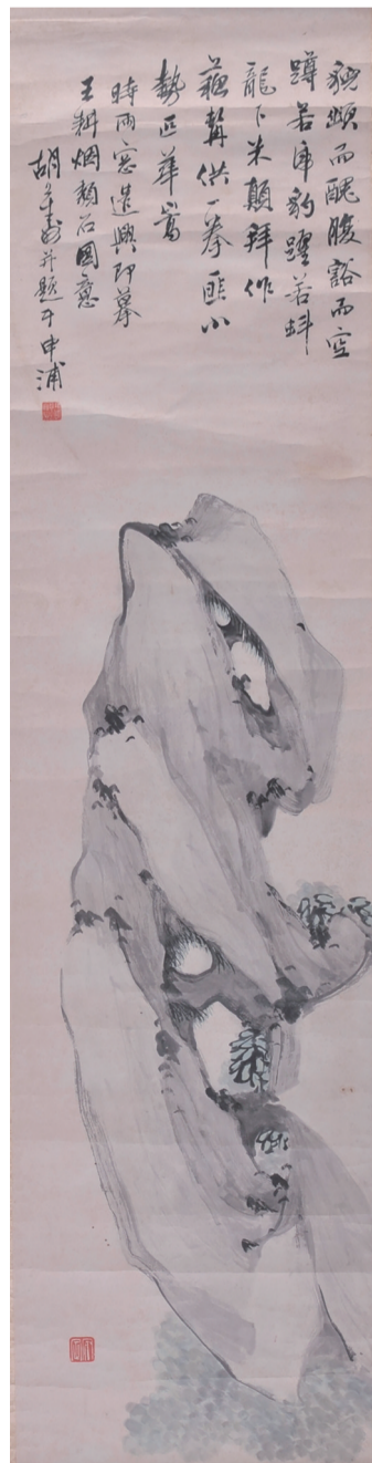
清 胡公寿 顽石图