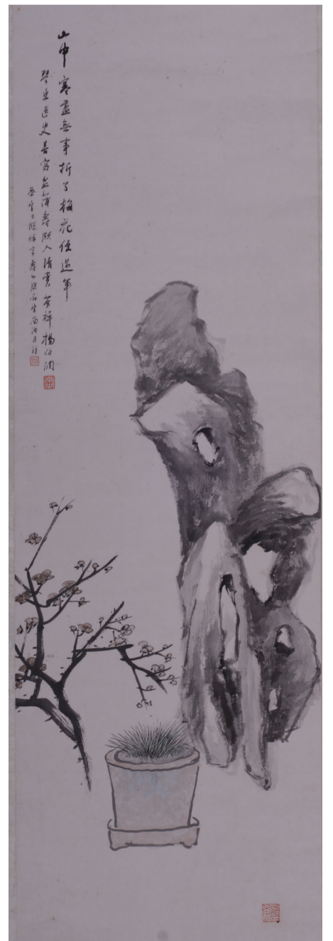
清 杨伯润 梅石图