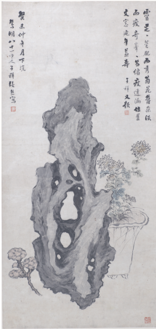
清 张薰 灵芝菊石图