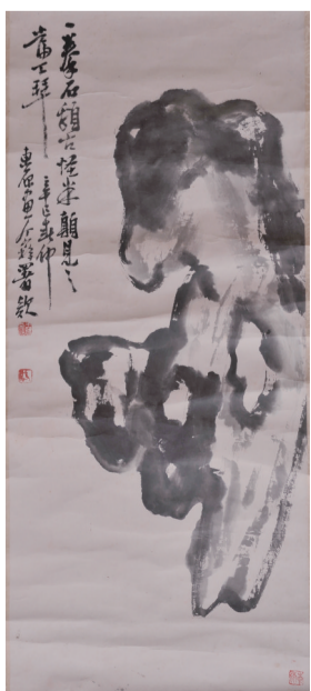
20世纪 王介籍 寿石图