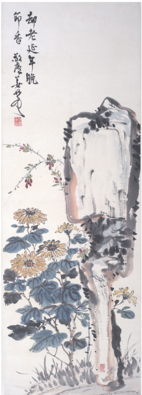
20世纪 姜丹书 菊石图