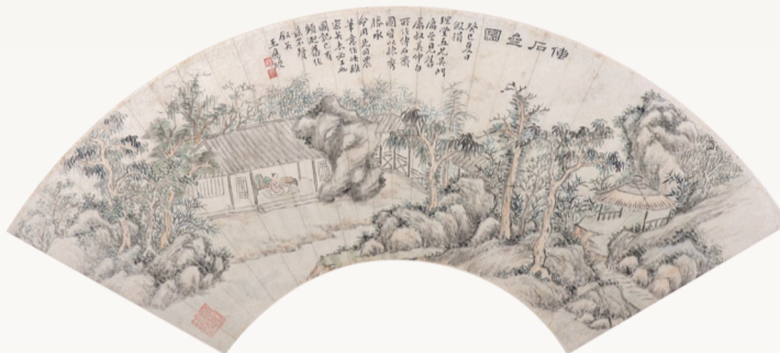
清 王应绶 传石斋图折扇页