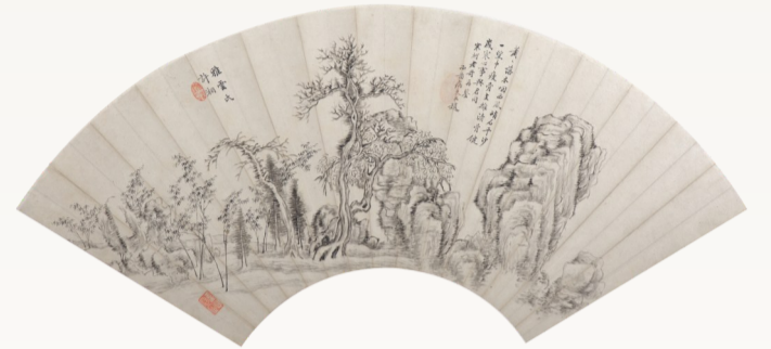
清 许湘 峭石平沙图折扇页