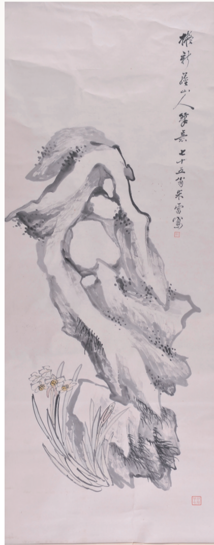
清 朱雷 墨石图