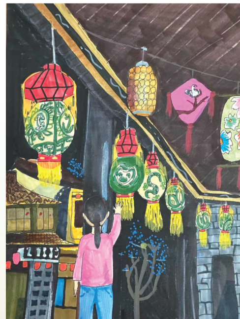
瓜灯映夜 ■毓秀小学514班 李雨桐 指导老师 张燕