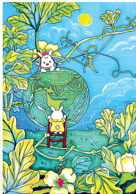
兔瓜灯趣 ■平师附小松风校区203班 许筱佳 指导老师 顾璐娜