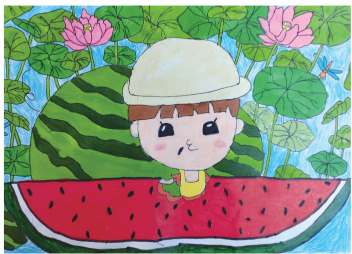
瓜乡瓜农 ■平师附小白马校区502班 王芮 指导老师 朱红梅