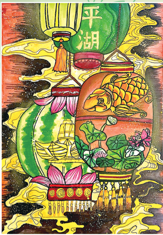
平湖灯影 ■毓秀小学213班 郭沁枝