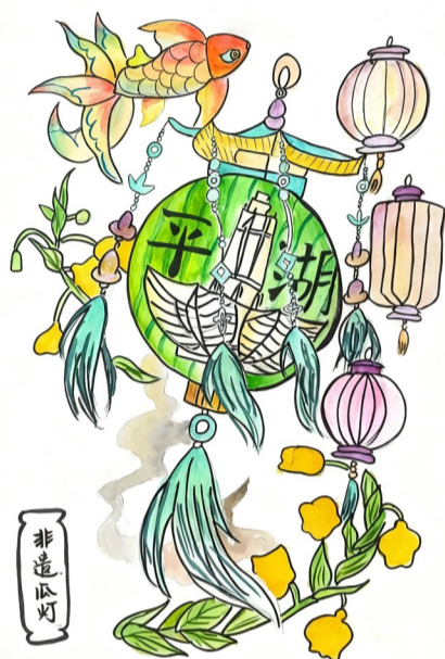
非造瓜灯 ■实验小学如意校区503班 胡苒沫 指导老师 史晔