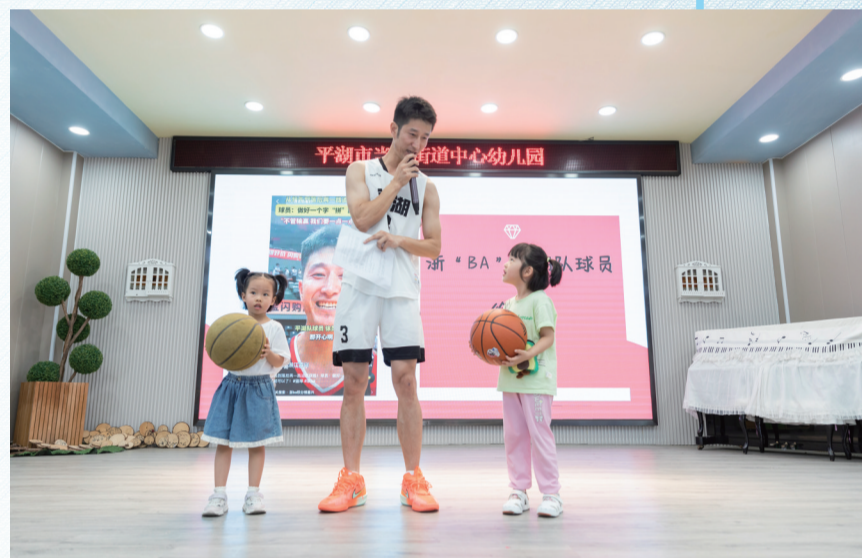
“浙BA”球员给孩子们上开学第一课