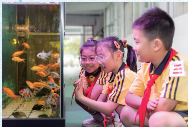
校园里有了鱼菜共生系统