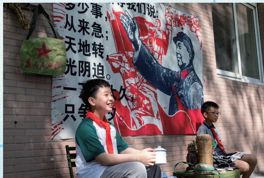
在新打造的红色主题长廊打卡