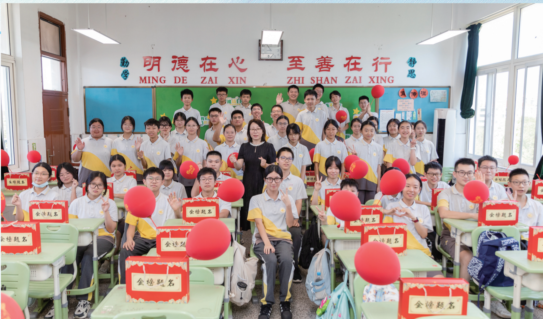
学生进入精心布置的新教室