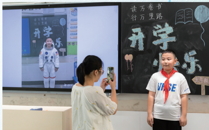
用AI新技术生成未来职业