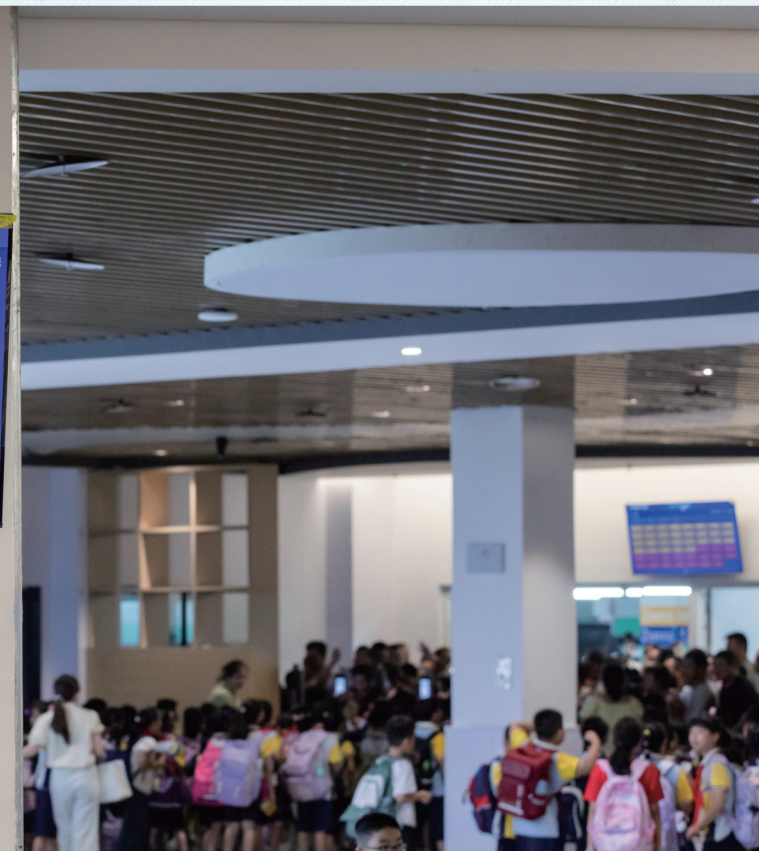
智慧车辆管理及学生接送系统启用