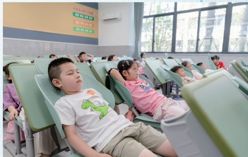
新校园实现“躺睡自由”