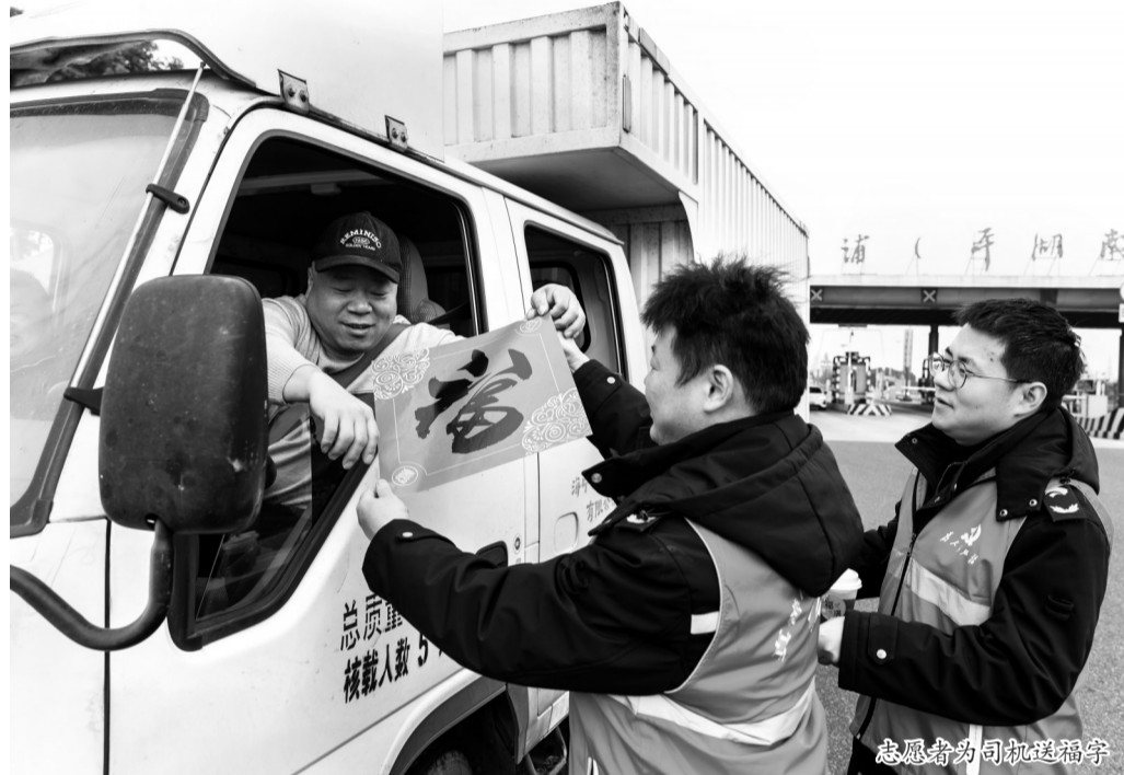
志愿者为司机送福字

“我来帮您拿这包东西吧。”在行李安检传输带旁,一名身着红马甲的志愿者正热心地帮旅客提着一袋行李,放在传输带上进行检查。原来,这是团市委招募的“暖心使者”。昨天,首批志愿者走上了岗位。他们帮旅客提行李,服务老年旅客使用电子