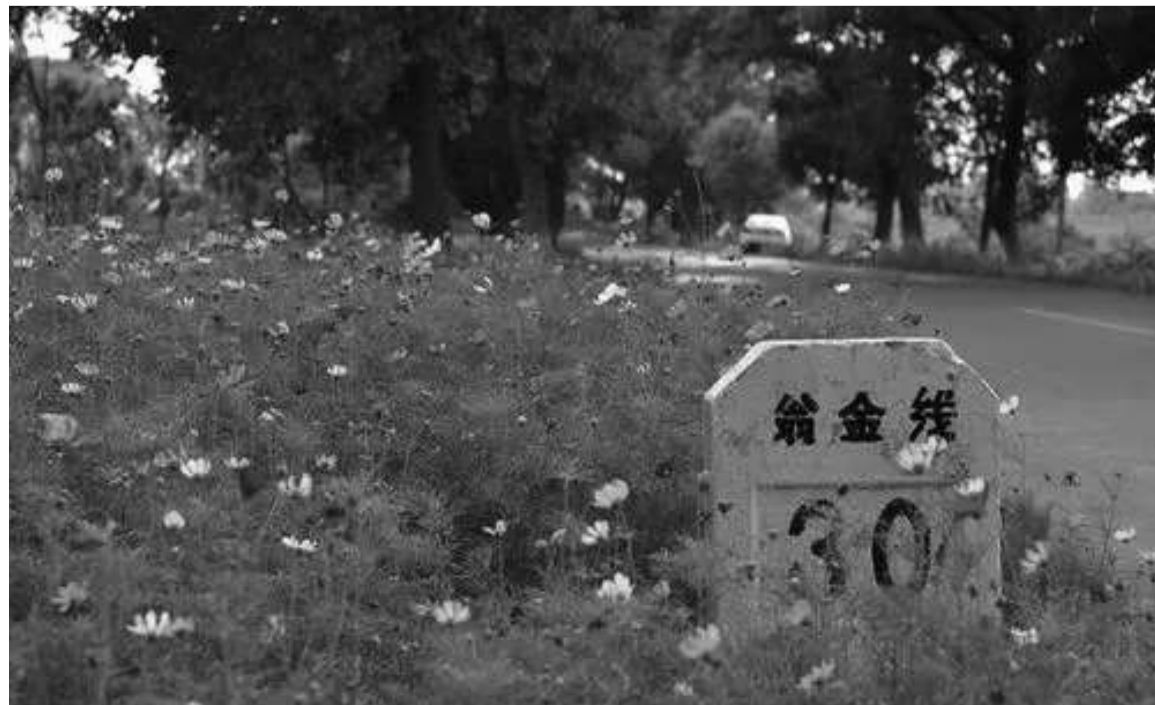
春日里的翁金线

面改建成沥青路面、水泥路面,部分路段和桥梁还经过了拓宽和截弯取直。但很多路段仍基本保留着原有的路况路貌,尤其是海盐和海宁段,很多路段道路弯弯曲曲,每隔一两百米就有一个弯道,还是连续弯道,甚至是盲弯,望过去就像是断头路。有些路段路基很高,高出地面有十来米,内侧是河,外侧就是一望无际的杭州湾。很多路段的两边绿树呈包围之势,夏日里行驶在上面,绿叶摇曳,蝉鸣幽幽,浓密的树荫遮蔽夏日的骄阳,就算是盛夏也非常凉爽。阳光透过树叶洒落在沥青路面上,犹如一幅画卷一般。在原始风貌的基础上,海宁把翁金线建成“中国最美郊野绿道”,两侧种满了银杏、桂花、樱花等乔木,着力打造“丹枫迎秋”、“樱花雪月”、“