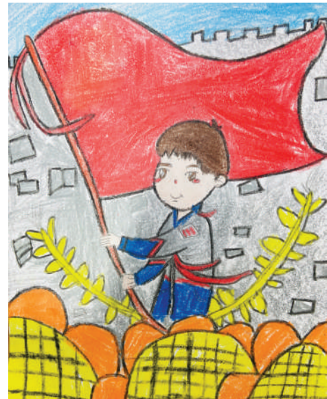
■红旗中成长 钟玥瑶 市青少年宫推送 指导老师 张予辰