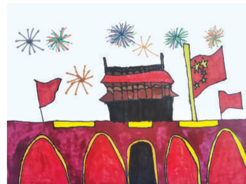
■庆祝 当湖中心幼儿园大一班 沈可念