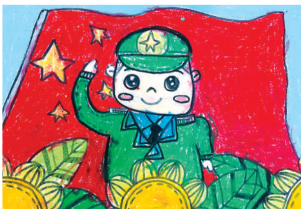
■向祖国敬礼 董佳铭 市青少年宫推送 指导老师 张予辰