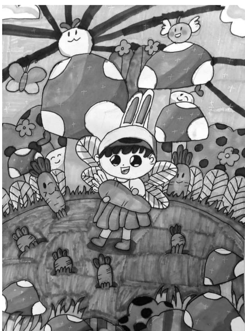
■欢乐的萝卜园 林埭中心小学201班 沈潇然 指导老师 王老虎