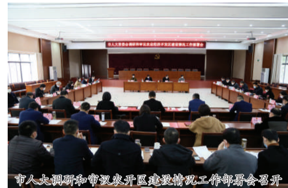
市人大常委会调研审议农开区建设情况工作部署会召开

农业经济开发区(以下简称“农开区”)建于广陈镇,北接上海最佳农业旅游景区之一的廊下生态园,属于平湖市级农业经济开发建设平台,但管理体制实行区镇合一。