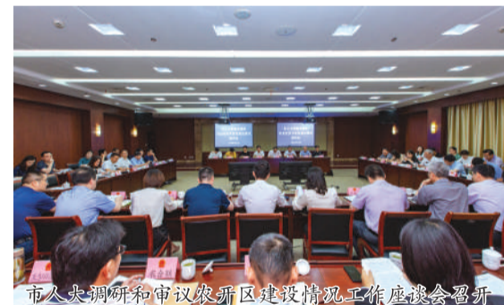
市人大常委会调研审议农开区建设情况工作部署会召开